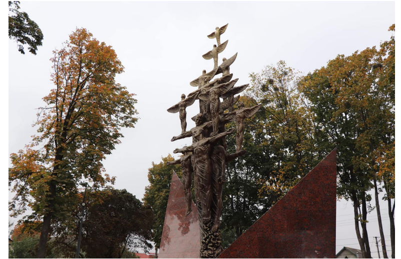
Пам'ятник Героям Небесної Сотні в Сумах.

Треба зазначити, що значна частина перейменувань у Харкові, Херсоні, Черкасах, Сумах, на Київщині (у Броварах, Боярці, Бучі, Фастові) тощо відбувалася в рамках декомунізації. Тут можна припускати вищий рівень «протискання» політики згори через потребу позбутися одіозних більшовицьких імен у публічному просторі. Наприклад, перейменованій у лютому 2014 р. вулиці Леніна на Героїв Небесної Сотні в Хоролі на Полтавщині у 2015 р. повернули стару назву. Це спричинило скандал, і громадськість таки змусила депутатів скасувати ганебне рішення. Імовірною причиною перипетій був той факт, що місцевий млинзавод