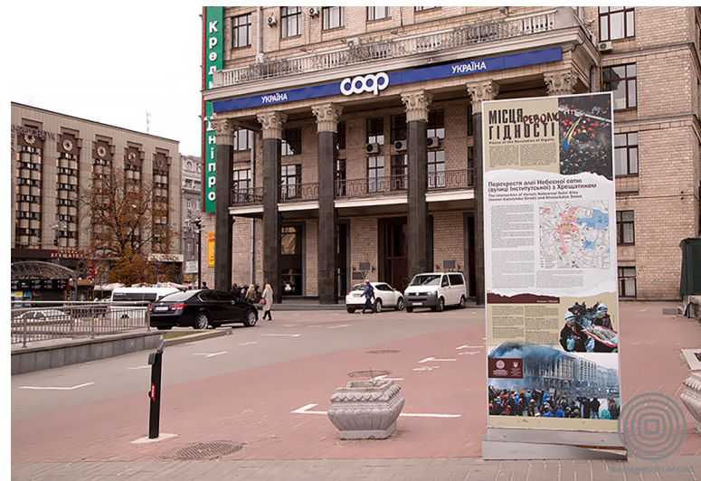
Система інформаційних вуличних стендів «Місця Революції Гідності». Місце на перехресті вулиці Хрещатик та алеї Героїв Небесної Сотні.

У цьому контексті треба згадати про проект будівництва музею Революції Гідності 31 , що переміг у відкритому архітектурному конкурсі 2018 р. Його ідея поєднує європейську класичну архітектуру, чітку образність, прозорий дизайн, метафору сходження на висоту з панорамою міста нагорі, створює досить вільного простору для різних форм комеморації,