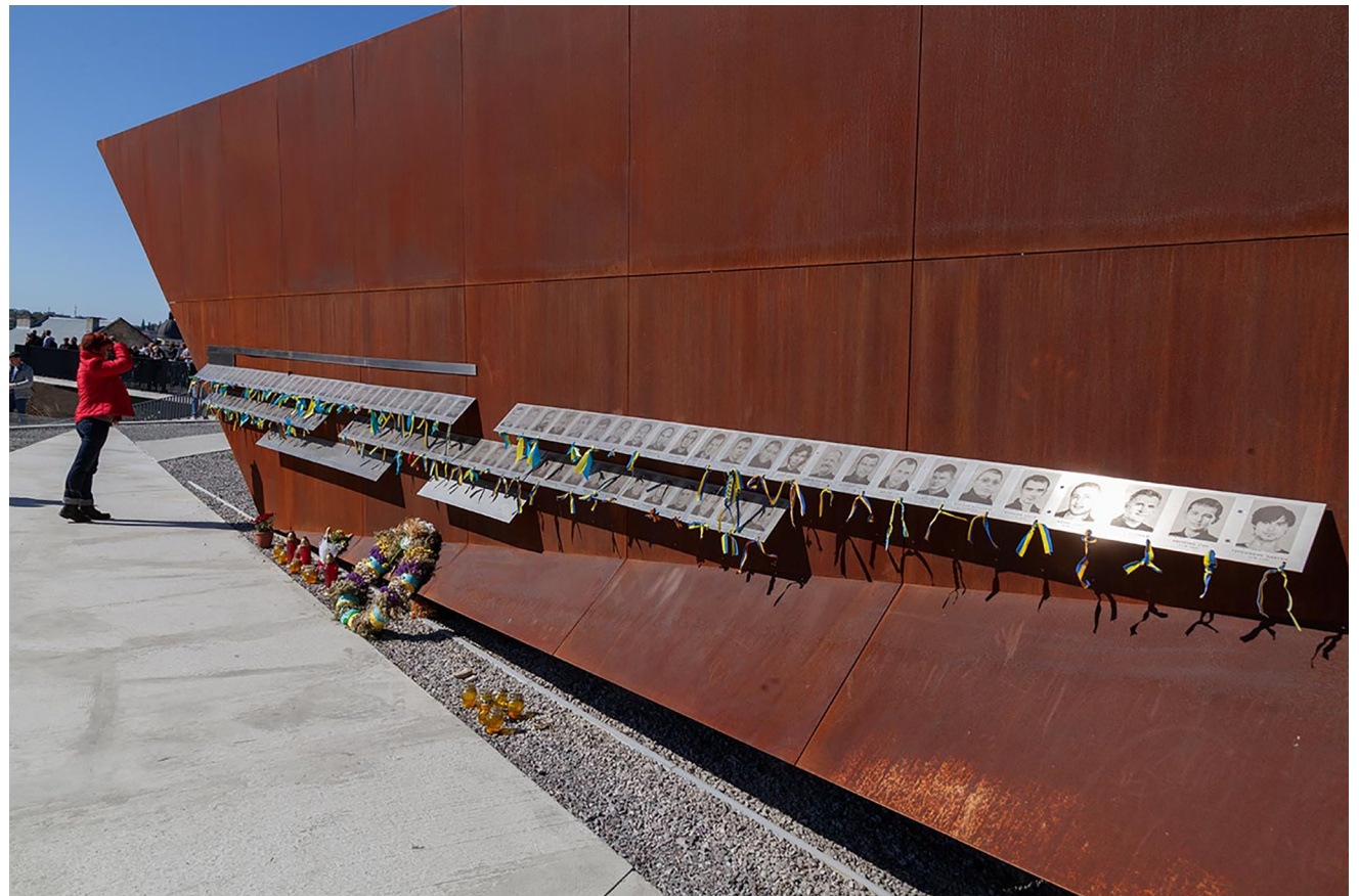
Частина стели Меморіалу пам'яті Героїв Небесної Сотні у Львові.