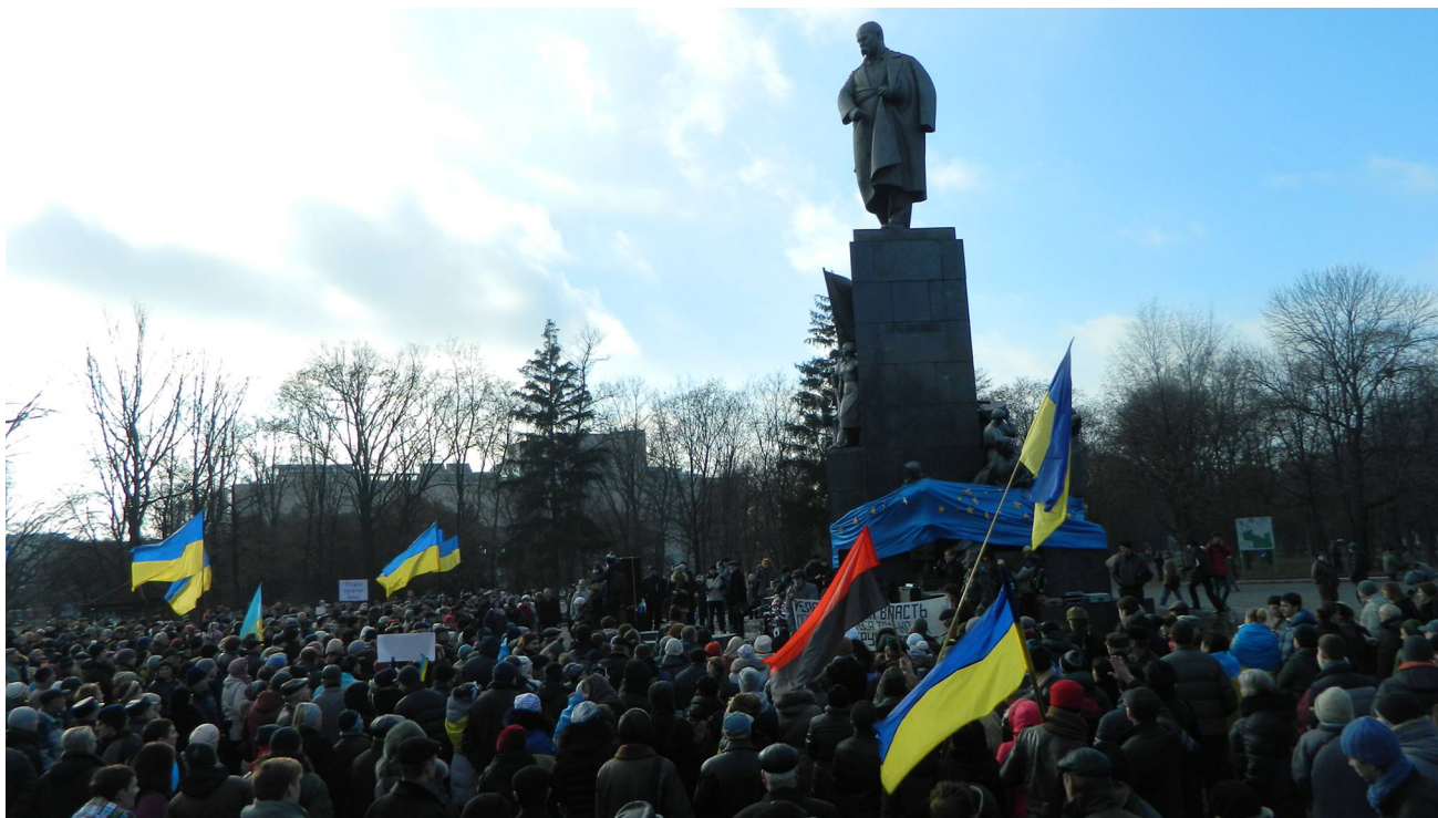
Євромайдан у Харкові, протести біля пам'ятника Тарасові Шевченку.

У культурному кодї євромайданівського простору також опинилися пам'ятники Іванові Франку (Львів), Степанові Бандері (Львів, Тернопіль), В'ячеславові Чорноволу (Миколаїв) тощо.