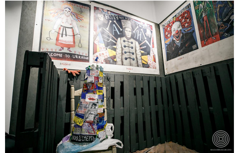
Виставка «Мистецький Барбакан» в Галереї протестного мистецтва.

Станом на липень 2022 р. просторові об'єкти меморіального комплексу Революції Гідності охоплюють Інфоцентр у Будинку профспілок, Галерею протестного мистецтва на вулиці Липській, публічний простір Бібліотеки Майдану в цьому ж приміщенні, низку позначених місць Революції Гідності й нині закриту інсталяцію «Куб». На місці розстрілів спорудили каплицю Архистратига Михаїла та українських новомучеників і встановили дерев'яний хрест із розп'яттям. У навігації меморіальним простором допомагає система інформаційних стендів «Місця Революції Гідності». Їх було встановлено одинадцять: на Михайлівській та Європейській площах, вулиці Інститутській (алея Героїв Небесної Сотні, верхній вихід зі станції метро «Хрещатик»), Хрещатику (Київська міська рада), Грушевського (дві локації), Будинку профспілок і Головноштамті, перехресті алеї Героїв Небесної Сотні (на початку галереї портретів Героїв Небесної Сотні) з Хрещатиком, а також на Майдані Незалежності біля Національної музичної академії. Біля торгового центру «Глобус» розмістили панорамні