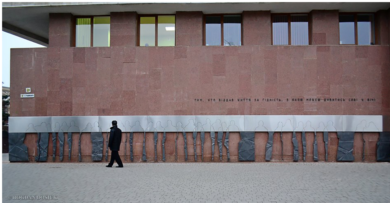
Монумент Героям Небесної Сотні в Івано-Франківську (автори – Юлія і Володимир Семків).

38 «Українці від Львова до Донецька також виходять на мітинги», Українська правда, 22 листопада 2013, https://www.pravda.com.ua/news/2013/11/22/7002698/ .