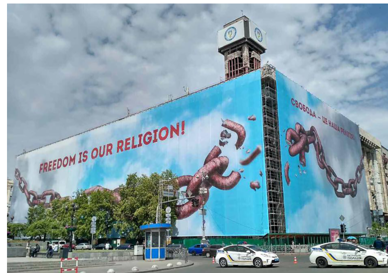
Будинок профспілок із банером «Свобода — це наша релігія» у Києві.

Сьогодні в Києві розташовано багато місць пам'яті. Столична мапа Революції Гідності охоплює такі топографічні об'єкти: Майдан Незалежності, вулиці Грушевську, Інститутську, Банкову, Хрещатик, Ольгінську, Кріпосний провулок, Маріїнський парк, Європейську площу, Софійську площу, парк Шевченка (локацію студентських мітингів), Михайлівську площу, Бессарабську площу та прилеглі простори. Важливі й окремі локації, наприклад, зруйнований Будинок профспілок і скинутий пам'ятник Леніну на Бессарабській площі