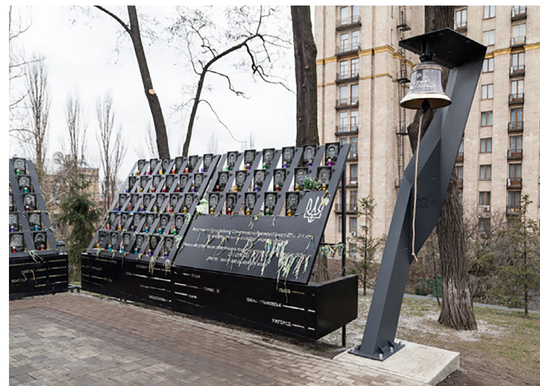
Дзвін Гідності на алеї Героїв Небесної Сотні.

Команда Національного меморіального комплексу Героїв Не-