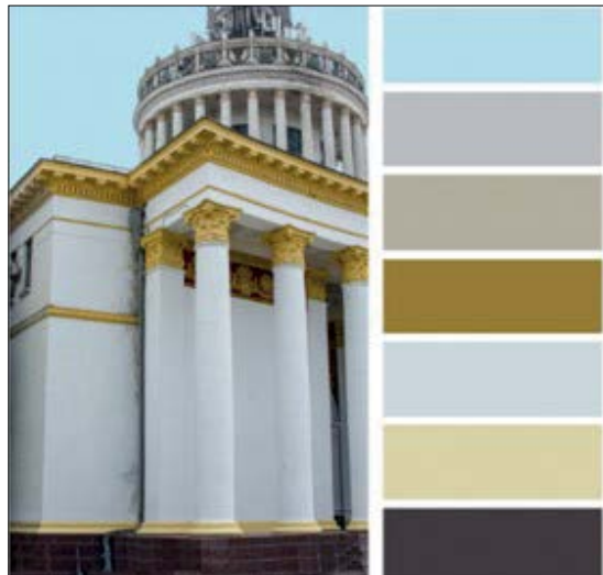
Рис. 22-23. Катерина Бучацька. «Кольорокоди». Колаж. 2021 р.

Практична ідея цього проекту полягає у необхідності відповідальніших підходів до збереження архітектурної спадщини ВДНГ.