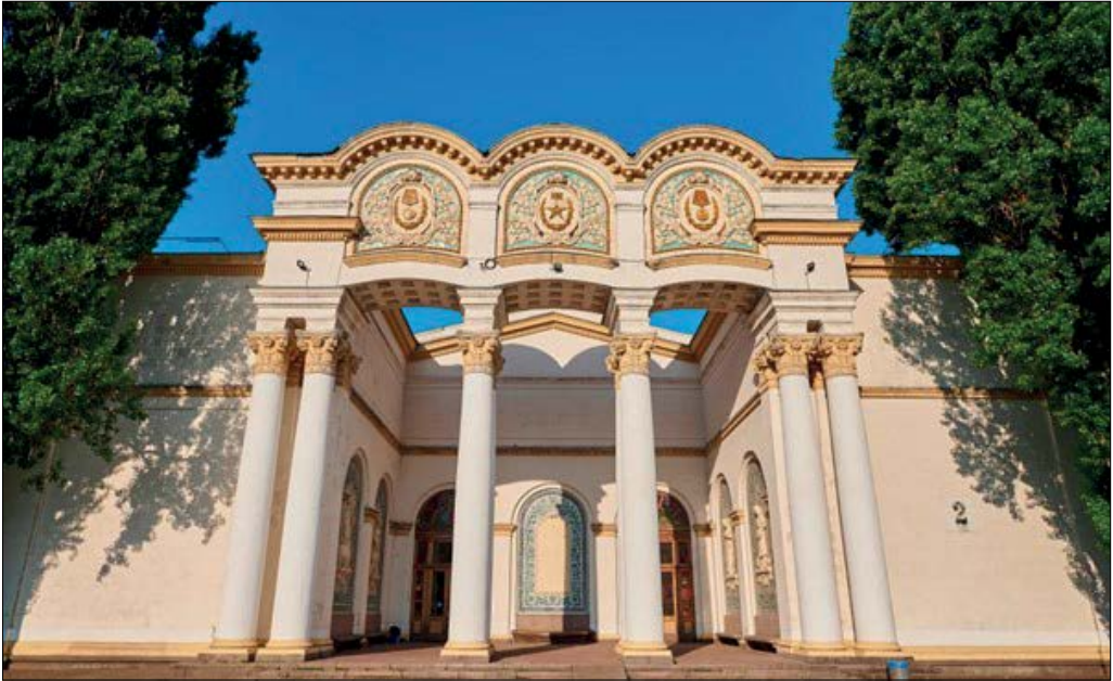
Рис. 12. Головний фасад павільйону «Тваринництво».