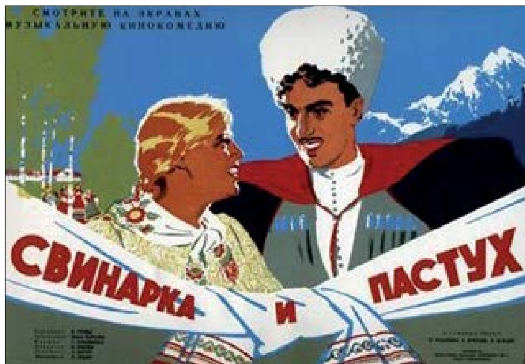
Рис. 2. Постер фільму «Свинарка і пастух», режисер Іван Пир'єв, 1941 р.