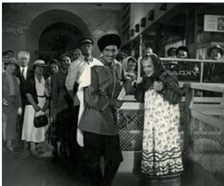
Рис. 1. Кадр із фільму «Свинарка і пастух», режисер Іван Пир'єв, 1941 р.