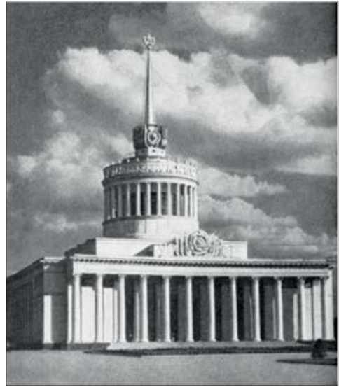
Рис. 4. Затверджений проект Головного павільйону (ескіз 1952 р., фото 1959 р., архітектори Б. Жежерін, Г. Кислий, інженер А. Мозговий). Архівний матеріал, наданий адміністрацією ВДНГ