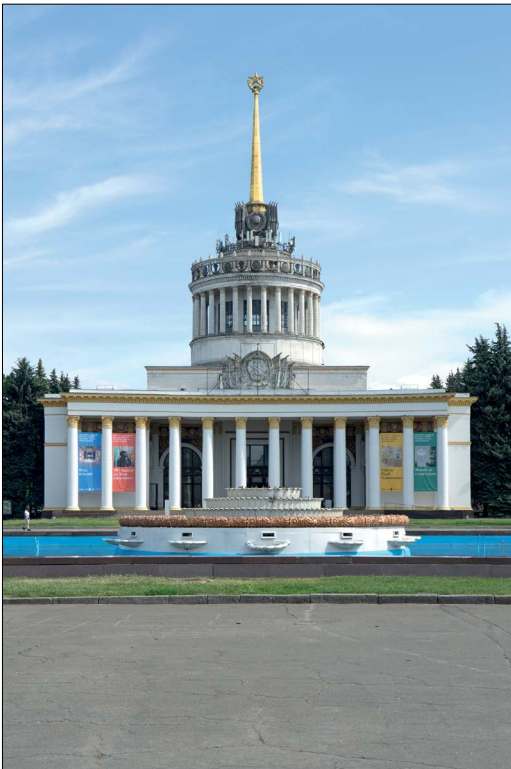
Рис. 5. Головний павільйон ВДНГ (павільйон № 1).