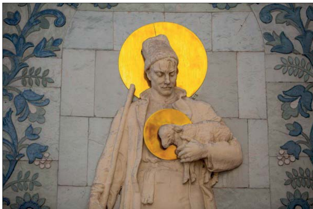
Рис. 14–15. Проект Жанны Кадирової «Реканонізація», інсталяція 2017–2020 рр.