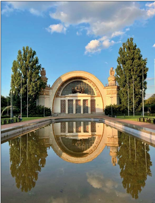
Рис. 9. Павільйон № 7 «Машинобудування та приладобудування» (архітектори Ігор Мезенцев, Віктор Савченко, Микола Губов).