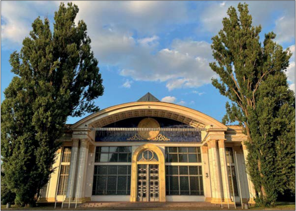
Рис. 8. Павільйон № 3 «Металургія» (архітектори Михайло Гречина, Олена Міхневич, Микола Губов).