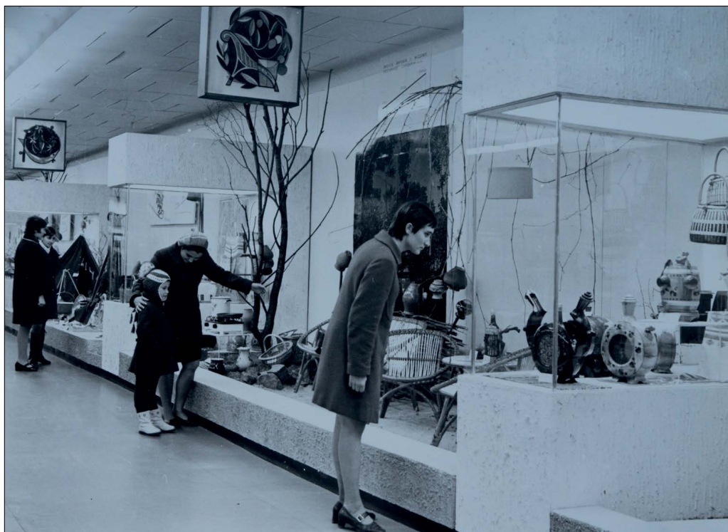
Рис. 20-21. Експозиція павільйону № 19 «Товари народного вжитку».