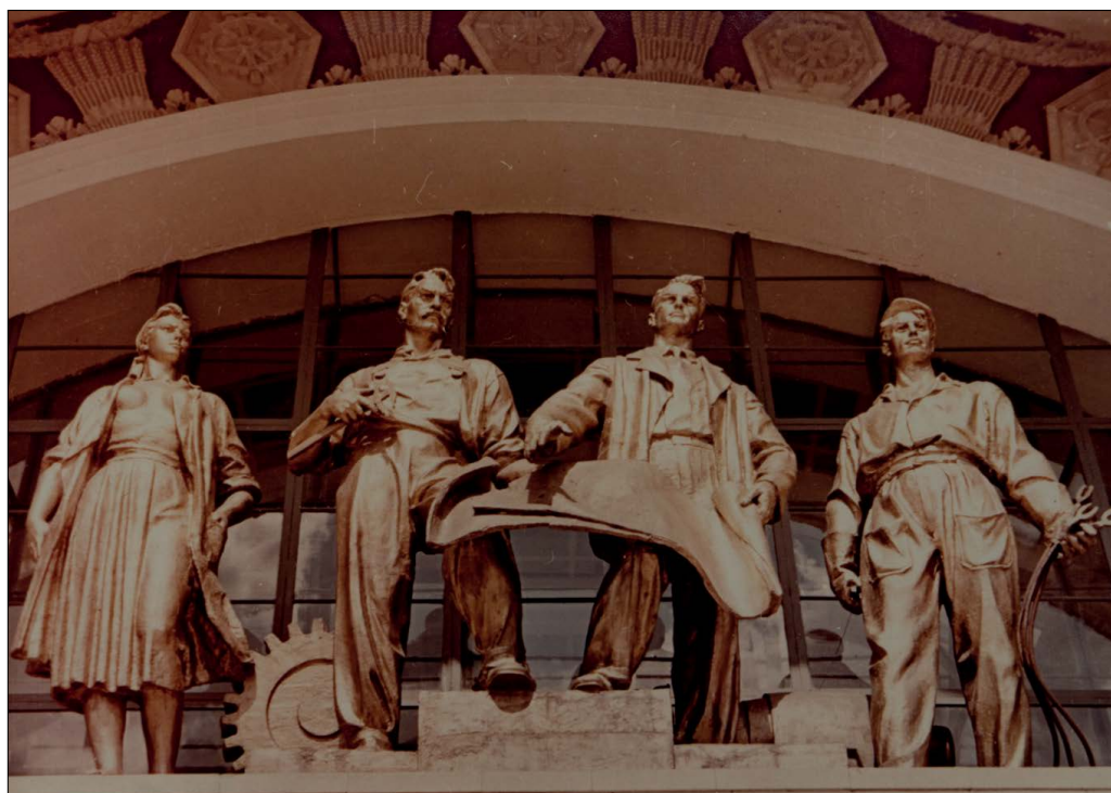
Рис. 10. Скульптурна група на фасаді павільйону № 7.