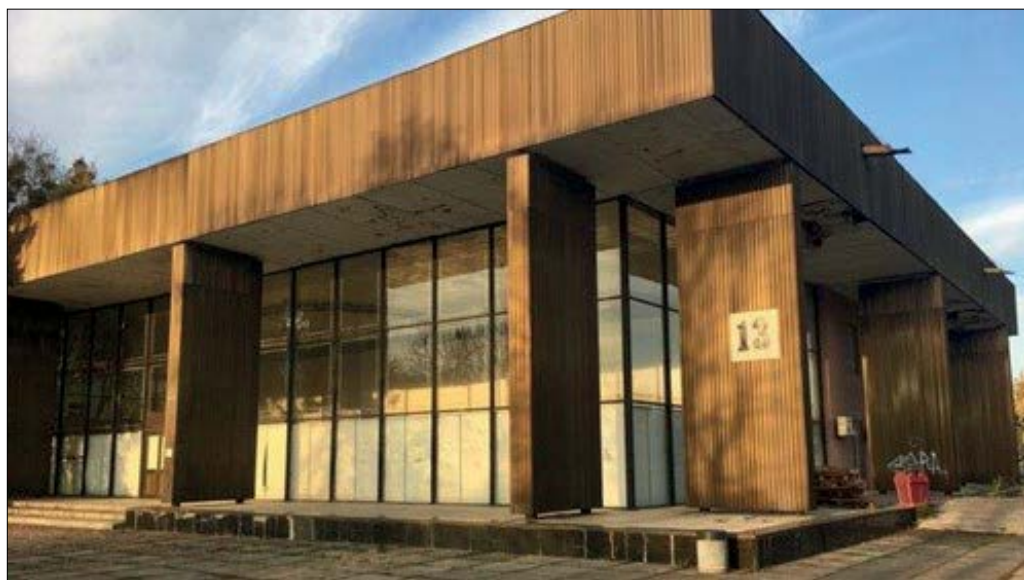
Рис. 11. Павільйон № 13 «Шахтарська промисловість».