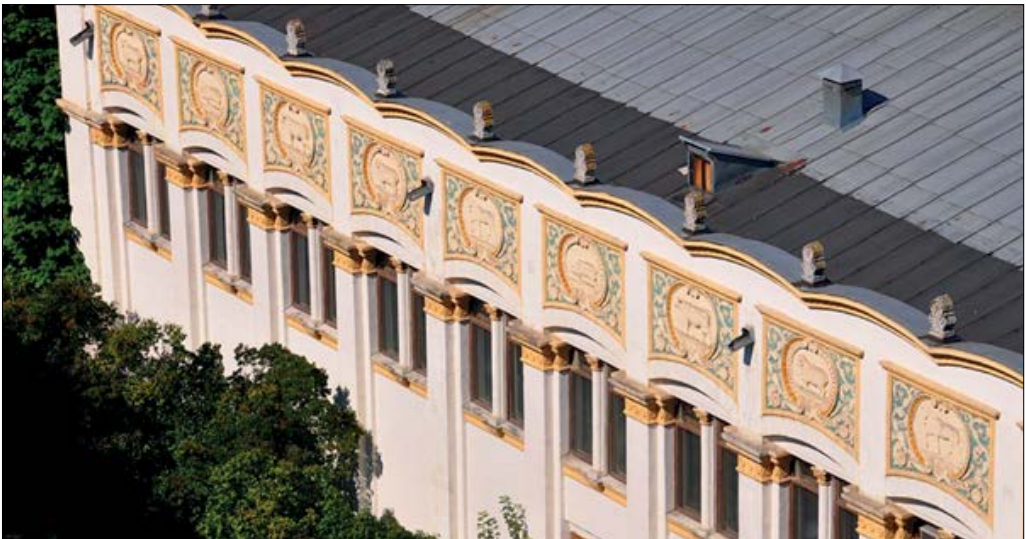
Рис. 13. Боковий фасад павільйону «Тваринництво» з медальйонами – зображеннями тварин.