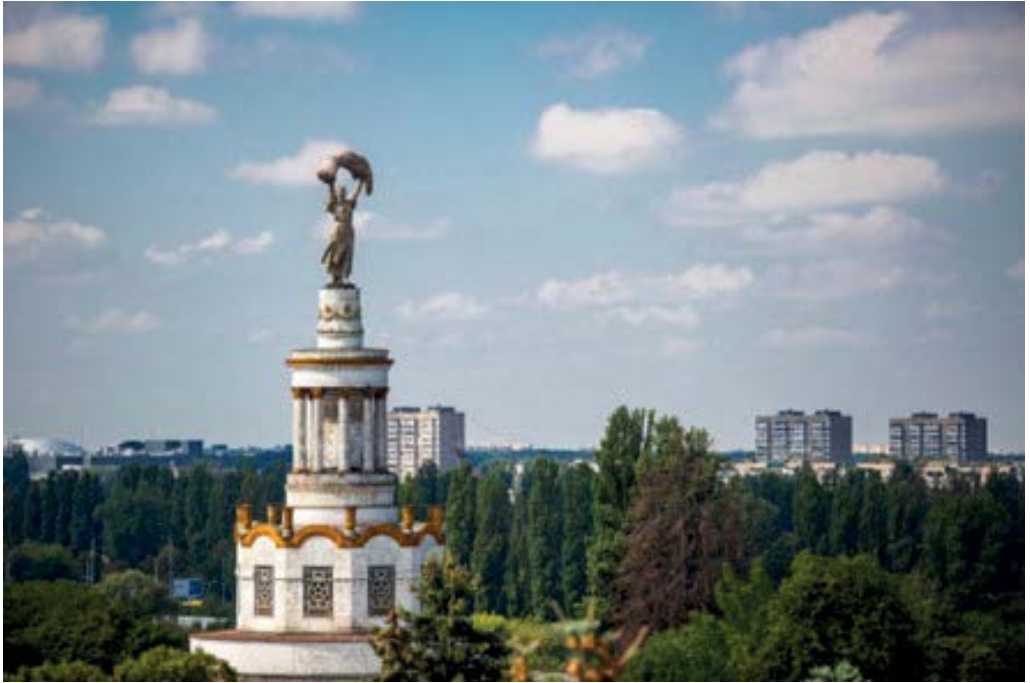
Рис. 6. Павільйон № 10 «Зернові культури» (архітектори Віктор Єлізаров, Ігор Ланько).