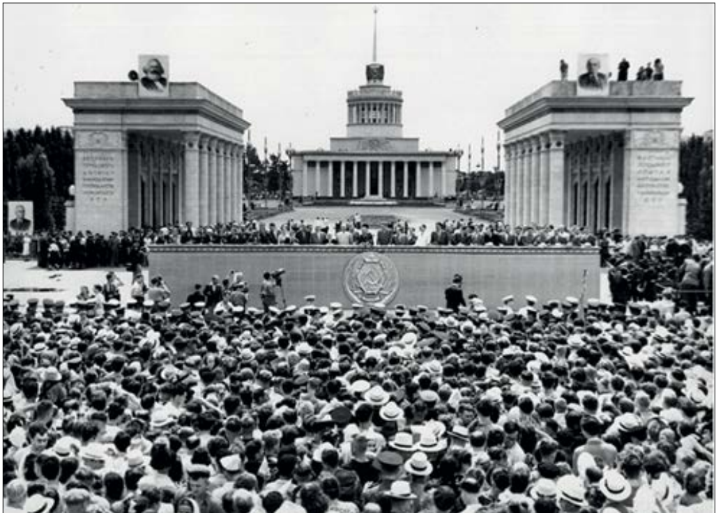
Рис. 3. Урочистий мітинг на відкритті Виставки (фото з архіву Експоцентру, 1958 р.)