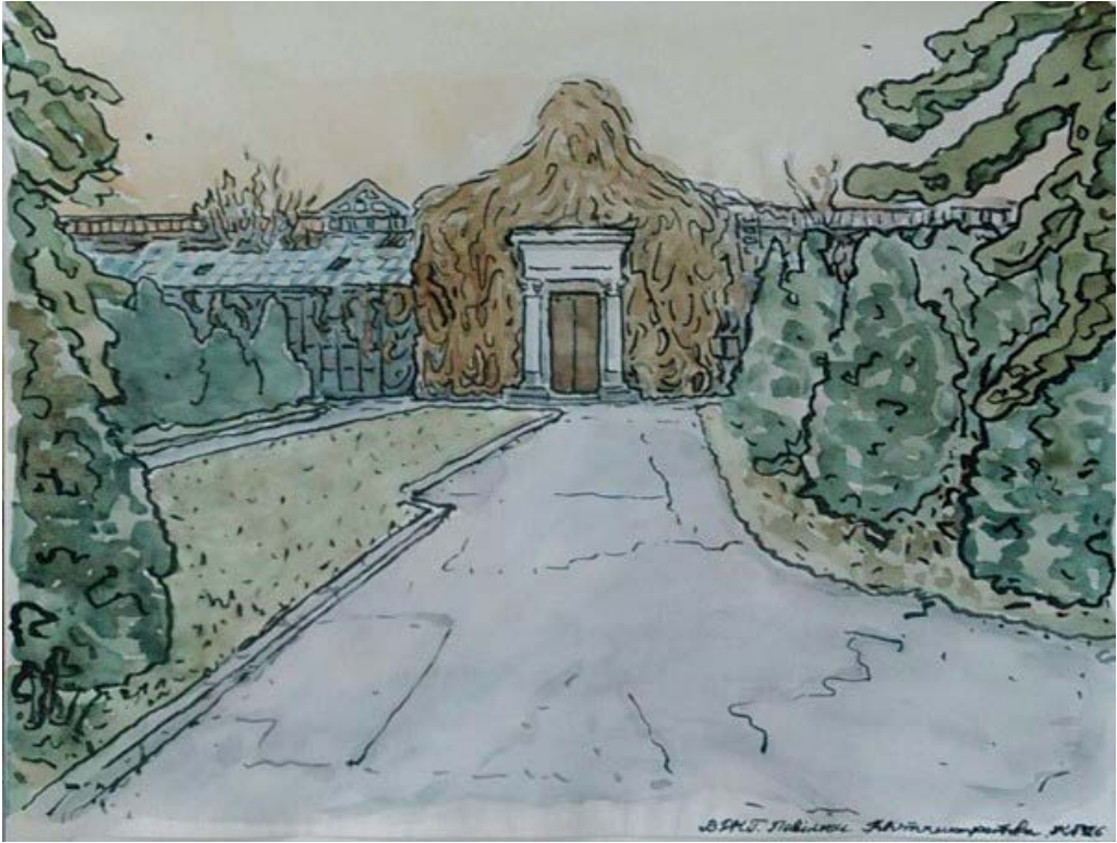
Рис. 19. Ксенія Гнилицька. «Павільйон № 10 ВДНГ», із серії «Стратиграфія». Акварель. 2016 р. Надано художницею