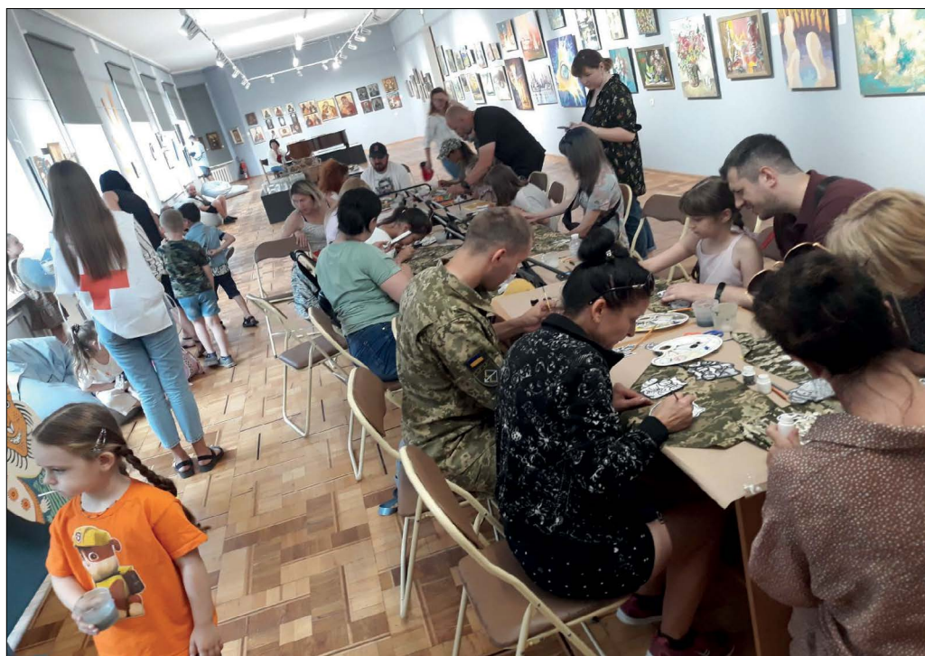
Рис. 16. Діяльність «ХОХМ_Арт_Хаб». Зал 4. 2022