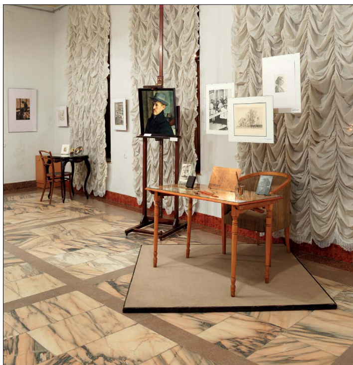
Рис. 8. Експозиція творів Георгія Верейського в ХОХМ. Зал 1. Початок 2000-х