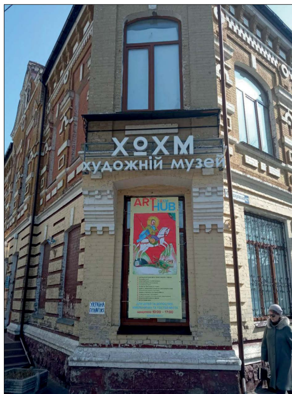
Рис. 17. Фасад ХОХМ, Хмельницький. Банер ХОХМ_Арт_Хаб. 2022