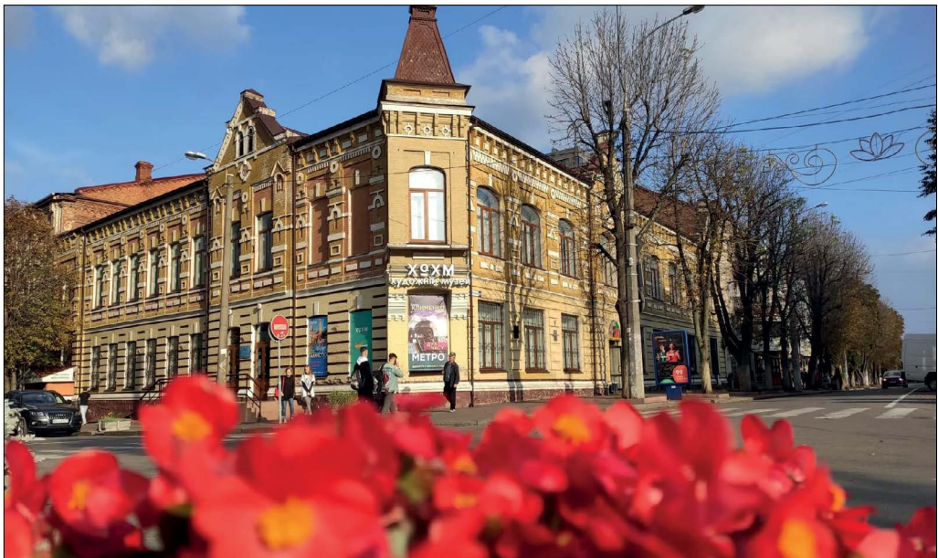
Рис. 12. Фасад ХОХМ, Хмельницький, вул. Проскурівська, 47. 2020

Проект «Натхненні Бойчуком» (2019) розповідав про учнів Михайла Бойчука (1882–1937), трагічну атмосферу 1920–1930-х років, а також сучасних художників, які у власний спосіб продовжують і розвивають традиції школи видатного митця, педагога, вченого, одного із засновників Національної академії мистецтв.