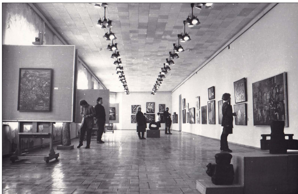
Рис. 1. Перша постійна експозиція з колекції ХОХМ. Зал 4. 1992