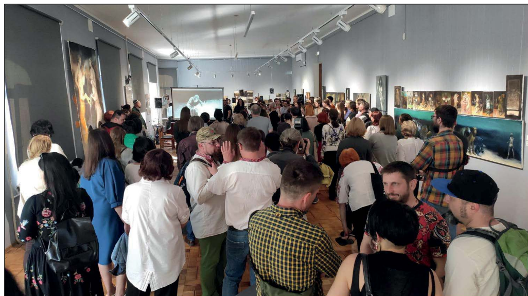
Рис. 18. Вернісаж виставки родини Школярів (Хмельницький). Зал 4. 2023