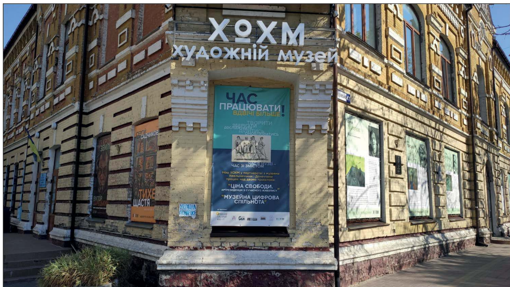
Рис. 19. Фасад ХОХМ, Хмельницький. Банер проєктів міжмузейної співпраці. 2023