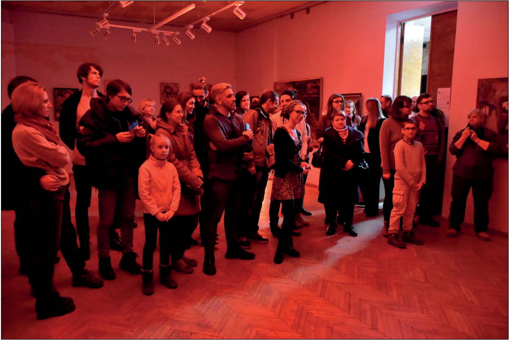
Рис. 13. Нічна інтерактивна екскурсія «Закохані в мистецтво» в ХОХМ. Зал 2. 2021