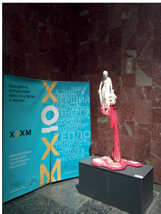
Рис. 15. Перший подарунок до колекції ХОХМ від початку повномасштабного вторгнення: поліхромна скульптура «Юдиф» Любові Якименко (Харків), подарована авторкою. 2022