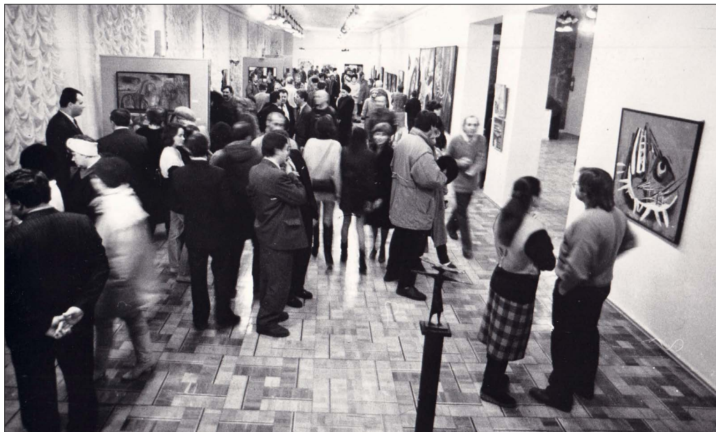
Рис. 6. Відкриття групової виставки Національної асоціації мистців «Хутір-2» в ХОХМ. Зал 4. 1996