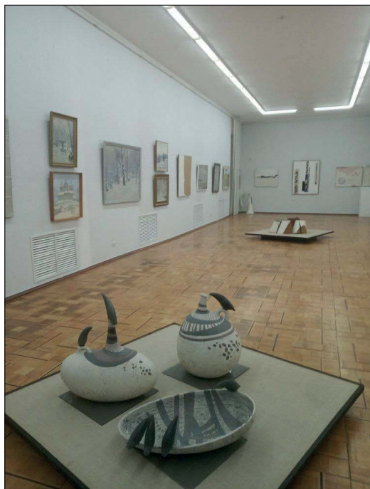
Рис. 14. Експозиція виставки з колекції ХОХМ «Всі відтинки... Білий». Зал 3, 2021

державних культурних установ увійшов і ХОХМ: «Хмельницький обласний художній музей вважають одним із перших в Україні музеїв сучасного мистецтва. Він був заснований на початку 1990-х років з акцентом саме на висвітлення напрямів сучасного українського художнього мистецтва. Завдяки цьому музей на сьогодні володіє багатьма яскравими його взірцями» 12 .