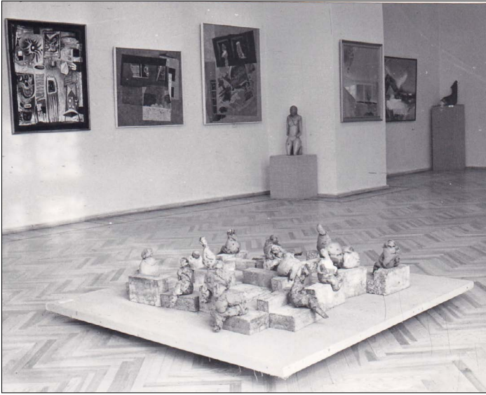
Рис. 3. Постійна експозиція з колекції ХОХМ. Львівська художня школа. Зал 2. 1994