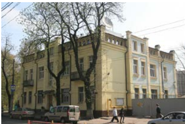
Рис. 3. Будинок № 6 по вулиці Овруцькій, остання адреса Володимира Правдича-Немінського в Києві. Фото 2016 р.