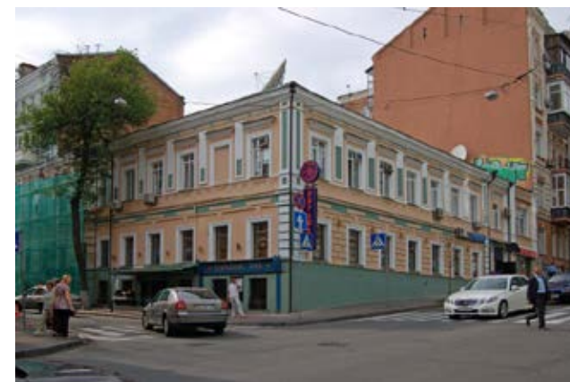
Рис. 1. Будинок, який належав В. С. Немінському до 1900 р. по вулиці Михайлівській, 17. Фото 2012 р.

ці Михайлівській, 17 та в Михайловському провулку, 2 (рис. 1). Цей подвійний будинок середини ХІХ століття належав з 1864 р.