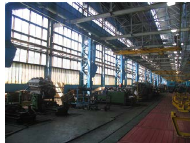
Рис. 7. Цех збірки тракторів ХТЗ, що функціонує нині.