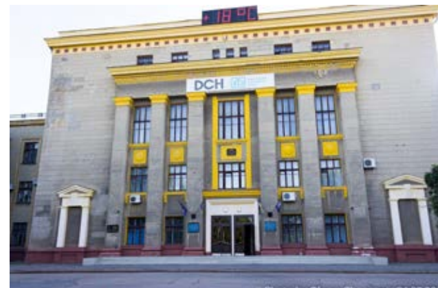
Рис. 6. Головна будівля заводу ХТЗ є пам'яткою архітектури у стилі ампір.

характерна для всіх постіндустріальних 14 суспільств, проте важливим є те, як її розв'язують 15 . Можна згадати вдалий досвід Рурського регіону в Німеччині, де колишні промислові підприємства перетворюють на туристичні атракції, забезпечуючи робочими місцями тисячі людей. Інший шлях – це створення майданчиків для креативних індустрій, зокрема колишня бавовняна фабрика у Лейпцигу 16 .