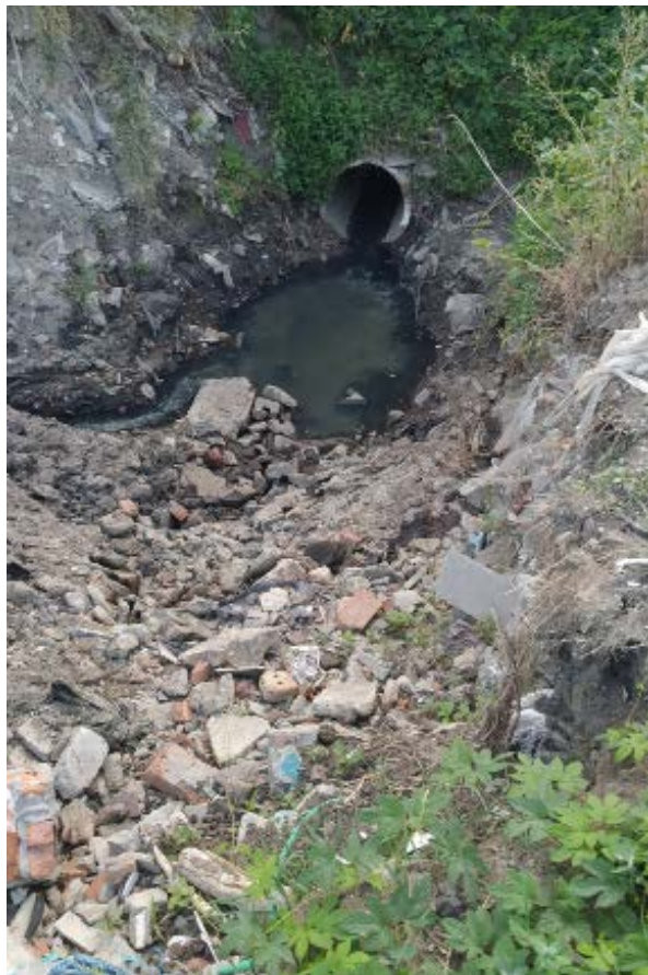
Рис. 11. Ділянка ймовірного русла р. Студенок, що межує з територією виправної колонії і куди постійно скидають сміття та нечистоти.