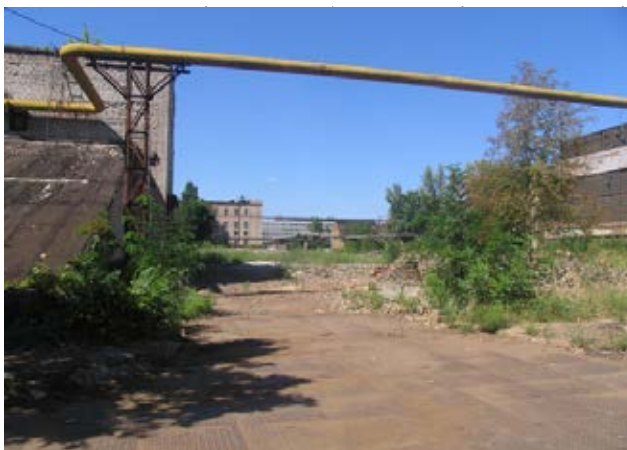
Рис. 8. Занедбана частина території заводу ХТЗ.