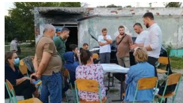
Рис. 10. Зустріч активістів ГО «Новий ХТЗ» із представниками департаменту комунального господарства, обговорення плану реконструкції парку «Зелений гай», серпень 2020 р.

Активісти, згідно із сучасними екогенденціями, наголошують на необхідності переорієнтувати простори ХТЗ з індустріальних до постіндустріальних, тобто таких, що будуть запроектовані відповідно до концепції сталого розвитку. Активні члени місцевої громади обурені тим, що проблеми парку (немає туалетів, недостатнє освітлення, викиди сміття та нечистот у яр та джерело, наступ гаражів і новітньої забудови на рекреаційні