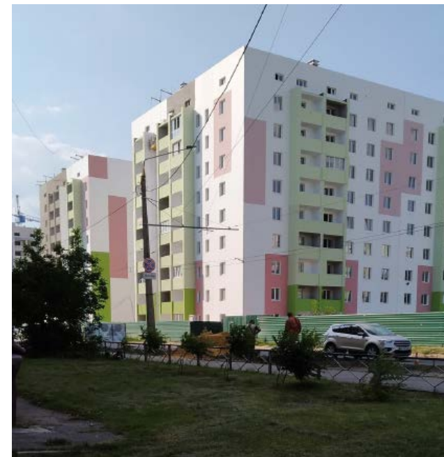
Рис. 12. Сучасна забудова по вул. Миру поблизу парку «Зелений гай».

стріальної спадщини наразі законом не врегульовано, можливий лише статус пам'ятки науки і техніки. З іншого боку, у деклараціях і діях як активістів, так і великого бізнесу ми не бачимо сприйняття цього об'єкта як спадщини, прагнення зберегти його автентичність.