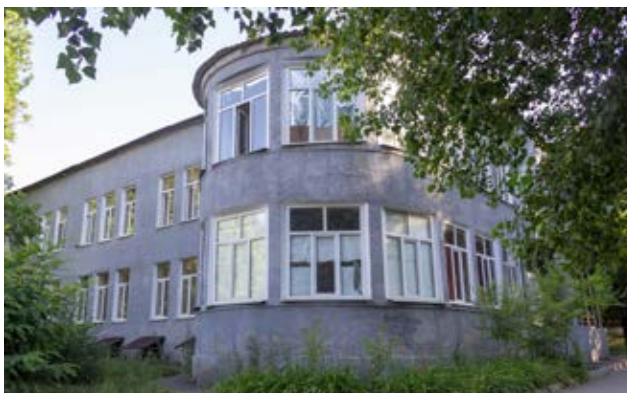
Рис. 5. Фонова забудова також становить інтерес, хоча вона вже не має початкового вигляду через металопластикові вікна або пофарбована у невластивий для стилю конструктивізму колір.

характерна для всіх постіндустріальних 14 суспільств, проте важливим є те, як її розв'язують 15 . Можна згадати вдалий досвід Рурського регіону в Німеччині, де колишні промислові підприємства перетворюють на туристичні атракції, забезпечуючи робочими місцями тисячі людей. Інший шлях – це створення майданчиків для креативних індустрій, зокрема колишня бавовняна фабрика у Лейпцигу 16 .