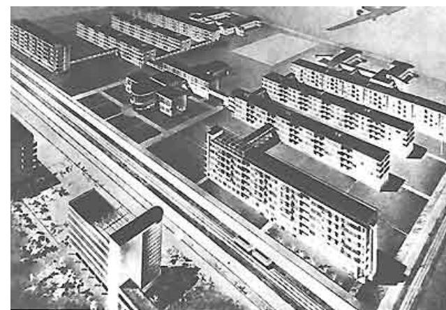
Рис. 1. Житловий комбінат

Харківський історик Роман Любавський досліджує, як змінювалось із часом сприйняття району 8 . Задуманий як поселення типу соцмісто подібно до інших сучасних йому («Червоний Жовтень», «Червоне містечко», «Нова Горлівка», «Культурна революція», «Новий побут» та ін.), він мав назву «Новий Харків», що маркувала його як соціалістичне поселення та концептуально протиставляла старому, «буржуазному» Харкову. Будівництво розпочалося у 1930 р. та велося за принципом житлових комбінатів (зокрема, концепцію обговорювали в рамках другої містобудівної дискусії 1929–1930 рр.) 9 , які поєднували житлову та соціальну інфраструктуру (див. рис. 1).