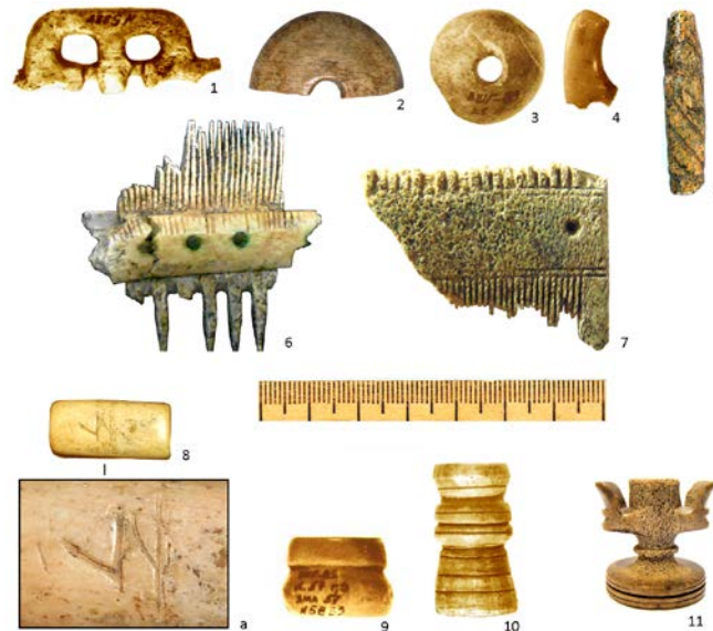
Рис. 4. Дрібні вироби: 1 – застібка недоуздка; 2–4 – гудзики; 5 – фрагмент вухочистки; 6, 7 – гребені; 8–10 – муфти; 11 – шахова фігурка

20 Пекарская Л. В., & Зоценко, В. Н. Археологические исследования, рис. 7, ліворуч.