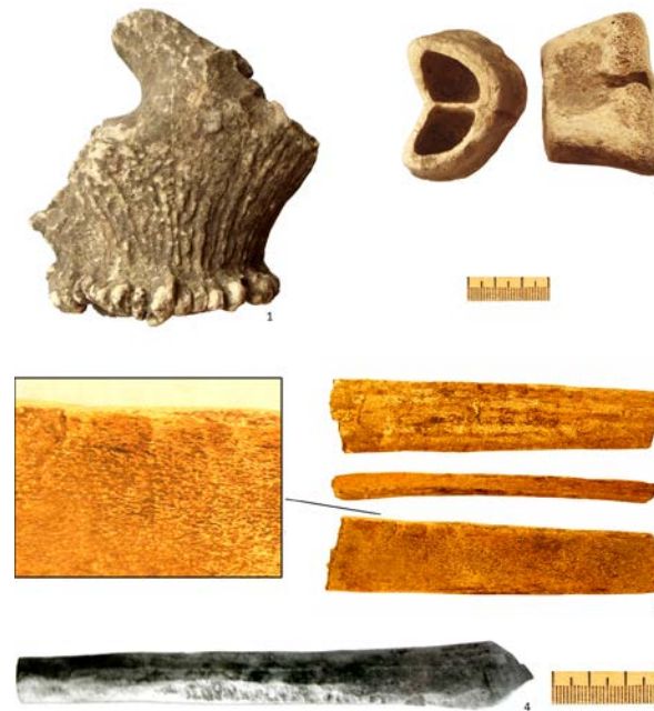
Рис. 6. Кістки зі слідами оброблення і напівфабрикати: 1 – ріг оленя зі слідами обробки; 2 – відпиляний епіфіз кістки – відхід виробництва; 4 – рогова пластинка, заготовка; 5 – напівфабрикат руків'я ножа. 5 – за В. Дорофєєвим та ін. (1989)

44 Гайдуков, П. Г., & Макаров, Н. А. (1993). Новые археологические материалы о пушном промысле в Древней Руси. Новгород и Новгородская земля. История и археология , 7, 179–188.