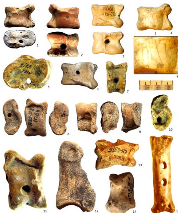
Рис. 2. Гральні атрибути: 1–14 – астрагали; 15 – гуркало

10 Сергєєва, М. С. (2002). До історії гри в бабки в Київській Русі. Археологія , 4, 55–56; Морозов, И. А., & Слепцова, И. С. (2004). Круг игры. Праздник и игра в жизни северорусского крестьянина (XIX–XX вв.) . Москва: Индрик, 643; Стрельник, М. О., Хомчик, М. А., & Сорокіна, С. А. (2009). Гральні кістки (III тис. до н. е. – XIV ст. н. е.) з колекції Національного музею історії України. Археологія , 2, 47; Kabzińska-Stawarz, I. (1991). Games of Mongolian Shepherds . Warsaw: Institute of the History of Material Culture, 17–28.