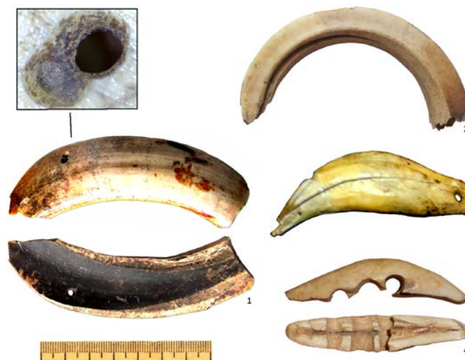
Рис. 3. Ікла тварин, амулети: 1, 2 – ікла вепра; 3 – ікло ведмедя; 4 – ікло з кількома поперечними каналами

15 Супруненко, О. Б., Пуголовок, Ю. О., Мироненко, К. М., & Шерстюк, В. В. (2009). Дослідження посаду літописної Лтави. Інститутська гора , 1. Київ, Полтава: ІА НАН України, Центр пам'яткознавства НАНУ і УТОПІК, ЦОДПА, 84, рис. 64, 2, 65, 9.