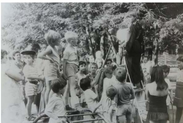
Мал. 8. «День Нептуна», 1980-ті рр.

16 Болдецкая, О., & Леонхардт, М. (1995). Большая семья. Двор и соседские отношения в старой части города Одесса. В Некоторые итоги Летней школы по социальной антропологии под руководством д-ра Биргитт Мюллер (Берлин, ин-т М.Планка) в Одессе . Одесса. Retrieved from https://sites.google.com/site/summerschoolodessa1995/boldetskay-Ironhargt-a-grait-family1995