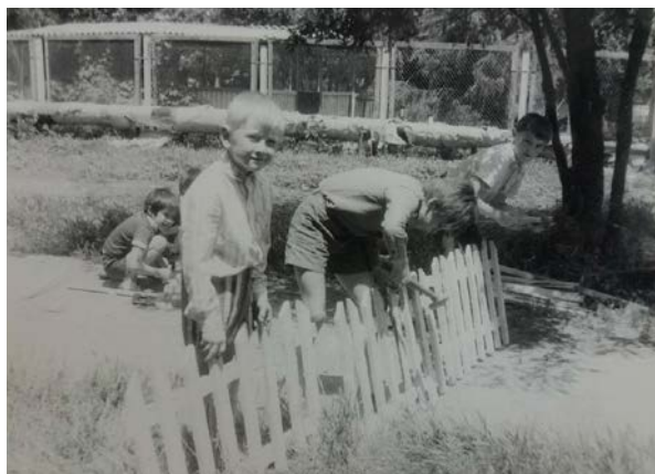
Мал. 7. Суботник з участю дітей, 1980-ті рр.